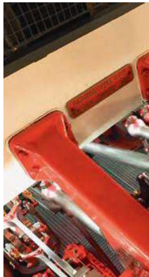
Blick in den Maschinenraum