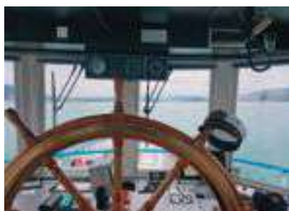
Blick vom Steuerhaus

chen Naturerlebnis. Auch die Schiffsnamen widerspiegeln diese Entwicklung. So gab es auf den Schweizer Seen einst eine «Germania», «Italia», «Viktoria», «France» oder «Gallia»; oder gibt es heute noch. Nicht zu vergessen natürlich unser eigenes Heimatland, stilvoll auf fast jedem eidgenössischen See unter dem Namen «Helvetia» in Fahrt gebracht. Die «Zürichsee-Helvetia» wurde 1875 gebaut und war mit einer Länge von 65 Metern das erste wirklich grosse Salon-Raddampfschiff auf dem Zürcher Gewässer und zur damaligen Zeit eines der längsten der Schweiz. Die Salons waren mit edlem Holz vertäfelt, es gab eine Damenkabine und getrennte Toiletten, grosse Fenster die mit Jalousien und Vorhängen versehen waren, Parkettböden und edles Mobiliar mit gepolsterten Sitzflächen. Um die Jahrhundertwende gipfelte der Schiffbau in immer luxuriöseren Fahrzeugen. Auch in der Schweiz, vor allem in den Tourismusgebieten in der Zentralschweiz, am Genfersee oder dem Berner Oberland, wurden richtiggehend schwimmende Gartenhäuser mit lichtdurchfluteten Räumen die mit Schnitzereien, Intarsien und Malereien ausgestattet wurden, auf Kiel gelegt. Die Belle Époque stand in ihrer Blütezeit, Eisenbahnen, Bergbahnen, Kurhäuser, Grand Hotels, Casinos und Restaurants mit