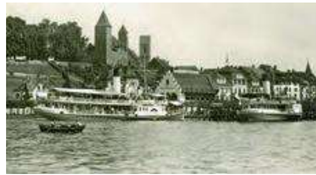
Die beiden Zürichsee-Dampfer Stadt Zürich und Stadt Rapperswil in Rapperswil um 1930

Oder trugen sogar Marketinggründe zum Beibehalten am altbewährten Schaufelrad bei? Ein Schaufelrad ist jedenfalls um einiges spektakulärer im Betrieb anzusehen als eine Schiffsschraube. Dies passte zum Schiff als Erlebnisfahrzeug. Vom Glattdeckdampfer ohne Komfort, ging die Entwicklung weiter zum schwimmenden und fahrenden Restaurant. Auf dem Zürichsee beispielsweise, erhielten die Dampfschiffe ab 1856 eine gemütliche Raucherkabine am Heck mit Fensteröffnungen auf jeder Schiffseite und ins achterliche Fahrwasser hinaus. Ab 1870 traten schliesslich die ersten Zweideck-Salondampfer in Erscheinung. Der Tourismus wurde immer wichtiger und die Schifffahrt zum gesellschaftli-