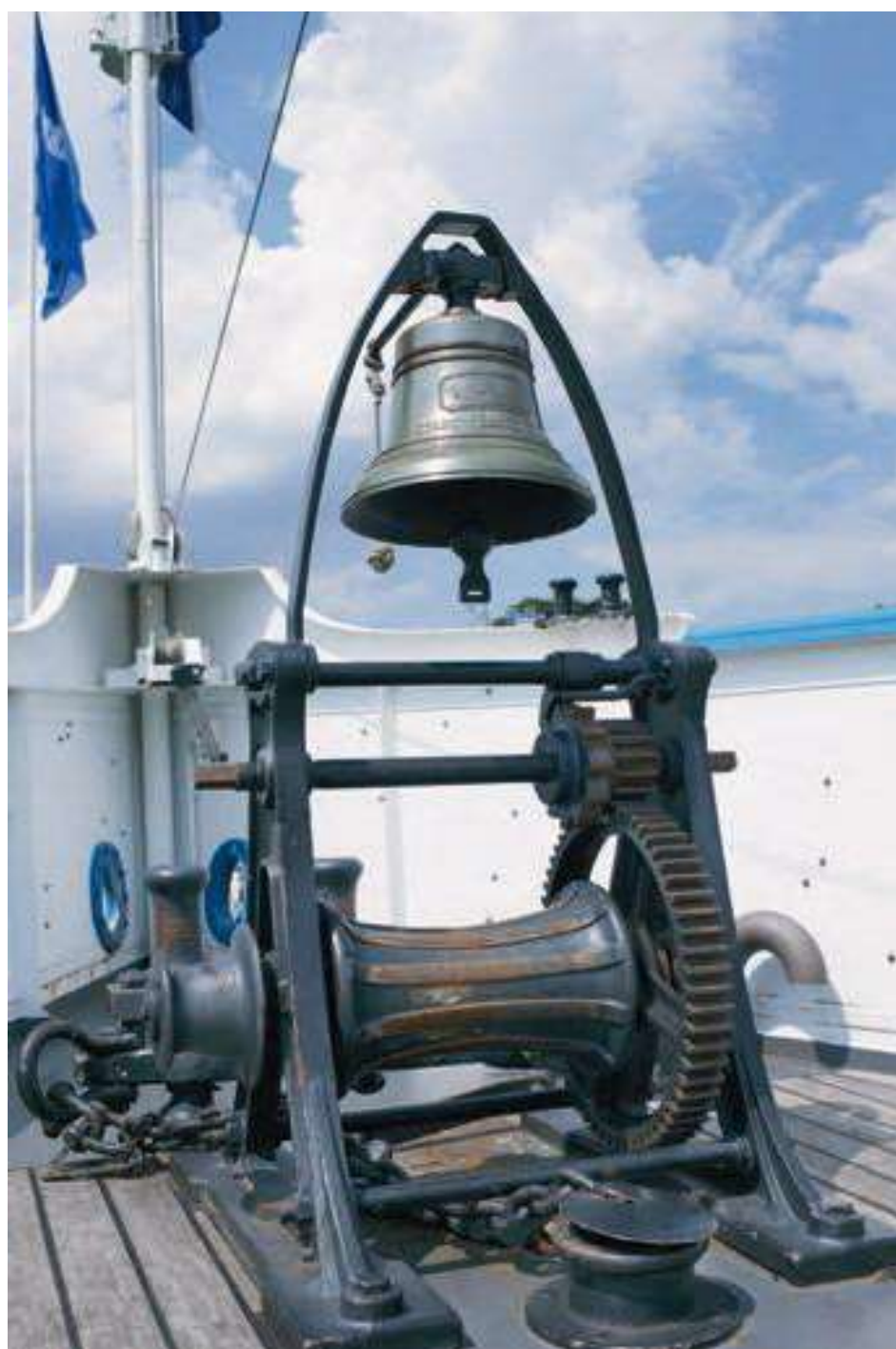
Die Schiffsglocke stammt noch vom ersten Dampfer mit diesem Namen