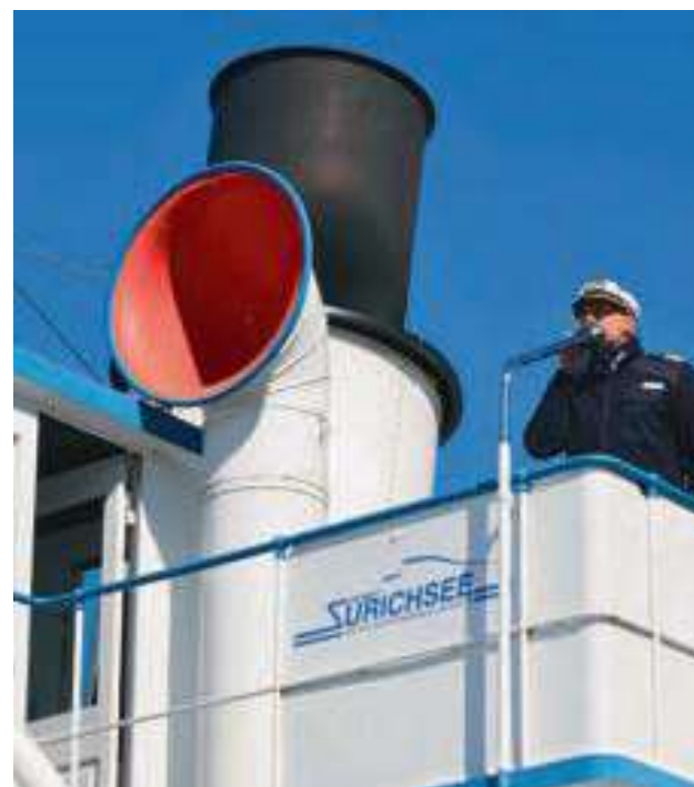
Der Kapitän erteilt seine Kommandos über das Sprachrohr