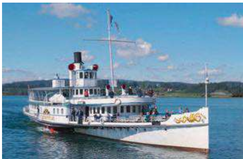
Anfahrt zum Steg Ufenau

zug am Decksträger des Oberdecks angehängt werden konnte. Am 16. März 1914 lief der Schiffsneubau vom Stapel und am 27. Mai konnte eine Belastungsfahrt unter Obhut des Eidgenössischen Eisenbahndepartementes durchgeführt werden. Das Schiff wurde mit 1500 Sandsäcken beladen, was 1000 Passagieren entsprach. Zwei Tage später fand die Jungfernfahrt nach Rapperswil statt, wo das neue Schiff mit Kanonenschüssen empfangen wurde. Am 31. Mai 1914, dem Pfingstsonntag, kreuzte der neue Dampfer bereits das erste Mal als Kursschiff über den See. Das Schiff war bei der Bevölkerung sofort sehr beliebt. Der Salon erster Klasse war in dunklem Holzwerk vertäfelt und Mobiliar aus Nussbaumholz verlieh dem Raum eine edle Note. Beim fünf Jahre jüngeren Schwesterschiff «Stadt Zürich» wurde der Salon mit Ahorn-Holz ausgebaut. Dem zahlenden Publikum war dies zu modern und hell. Wohl deshalb wurden beim jüngeren Schwesterschiff wieder die klassischen, dunklen Hölzer verwendet. Während der beiden Kriege wurden die Zürichsee-Dampfer mit Holz befeuert. Kohle war rar und teuer. 1950 wurde die Feuerung der Stadt Rapperswil auf Schweröl umgestellt, ab 1973 wird aus Gründen des Umweltschutzes nur noch leichtes Heizöl (Diesel) verfeuert. Heute gehen die neuesten Zukunftsvisionen in der Schweizer Dampfschiffahrt bereits Richtung CO 2 -neutrale Holzpellet-Feuerung.