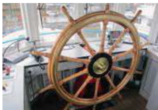
Das hölzerne Steuerrad ist nicht mehr in Betrieb

französischem Namen schossen wie Pilze aus dem Boden. Vermögende Touristen reisten mit grossem Gepäck und viel Personal in die Schweiz oder durch die Schweiz hindurch und weiter in den Süden oder Osten. Auf dem Zürichsee folgte mit der «Stadt Zürich» 1909 ein neuer Salondampfer. Fünf Jahre später wurde als einer der letzten Raddampfer aus der Maschinenfabrik Escher Wyss das Schwesterschiff «Stadt Rapperswil» abgeliefert. Der erste Weltkrieg setzte der Blütezeit im Schweizer Tourismus ein jähes Ende.