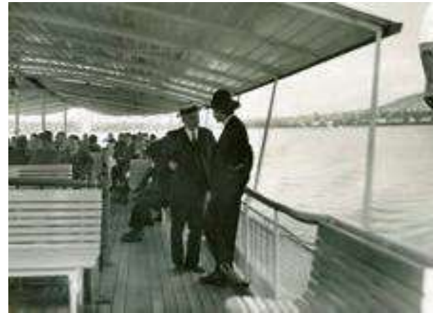
An Deck um 1950