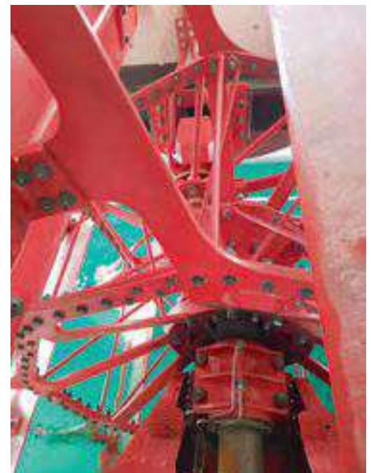
Blick auf das Schaufelrad