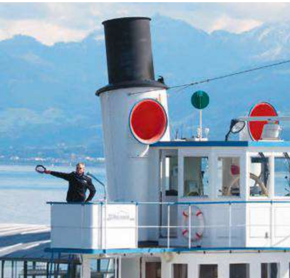
Vorbeifahrt mit Gruess