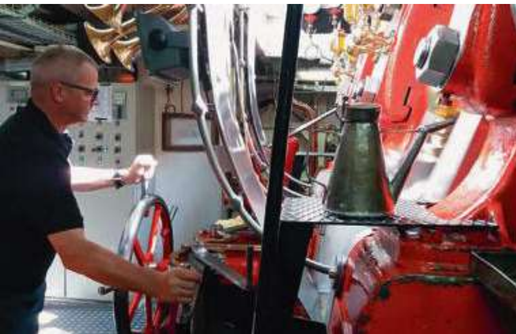
Konzentriert erwartet der Maschinist den Fahrbefehl

Um es vorweg zu nehmen: Mittlerweile arbeiten sehr viele Damen in der Schifffahrtsbranche in verschiedenen Chargen (auch als Kapitän oder Maschinist). Trotzdem reden die professionellen Schiffsleute immer noch von Mannschaft. Die betroffenen Frauen stören sich im Übrigen, im Gegensatz zu diversen alternden Journalistinnen oder Politikerinnen, am allerwenigsten daran. Es ist schlicht absolut kein Thema! Je jünger die Mitarbeiterinnen, desto weniger. Die Damen wollen sogar explizit mit der männlichen Berufsbezeichnung angesprochen werden und finden es schlichtweg mühsam, wenn das Thema Emanzipation nur schon aufgegriffen wird! Dies resultiert vielleicht auch daher, dass beispielsweise Kapitän ursprünglich gar kein Beruf sondern ein militärischer Grad war und die Berufsbezeichnung sich aus der Ma-