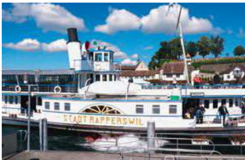
Anlegemanöver in Rapperswil

chen Dienstbeginn in den ersten Betriebsjahren des Schiffes, als der Heizer rund 5 Stunden vor dem Ablegen den Kessel anfeuern musste, kommt der Maschinist mit Heizerdienst heute rund zwei Stunden vor Abfahrt und dreht den Schalter für die Brennersteuerung. Das ist die ganze Heizerarbeit. Damit hat er den Ölbrenner auf Betrieb gestellt und heizt den Dampfkessel nun von ca. 4 bar wieder auf die benötigten 10,5 Atmosphären Dampfüberdruck. Selbstverständlich gilt die überlieferte Heizer-Weisheit noch immer: «Der erste Blick sei zugewandt, dem Kesseldruck und Wasserstand». Nur werden sämtliche Ventile für Kesselspeisung, Druck- und Trinkwasser, WC-Spülung etc. geöffnet, allenfalls das Kesselwasser wieder ergänzt und diverse Sicherheitstests durchgeführt. Auch die Gastronomie-Technik wie Kühlanlagen müssen gewartet werden. Anschliessend werden Seefilter gereinigt und die Seewasser-Enthärteranlage für die Reinigung des Trinkwassers und des Dampfkessel-Speisewassers in Betrieb genommen. Ein Dampfschiff ist auch heute noch ein normales Kursschiff und muss sämtliche Sicherheitsanforderungen nach heutigen Vorschriften erfüllen. Auch die Gastronomie wird gesetzlich gleichbehandelt wie ein Restaurant an Land. Das Trinkwasser welches von