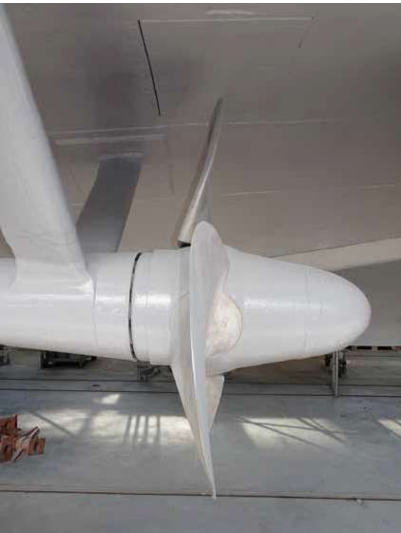
Linth Propeller Bb, Nullstellung