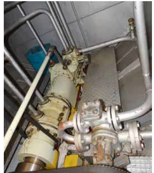
Servo MS Etzel