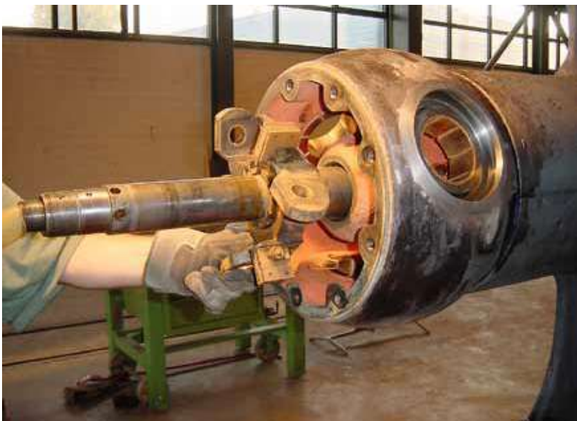
Nabe geöffnet, Flügel entfernt