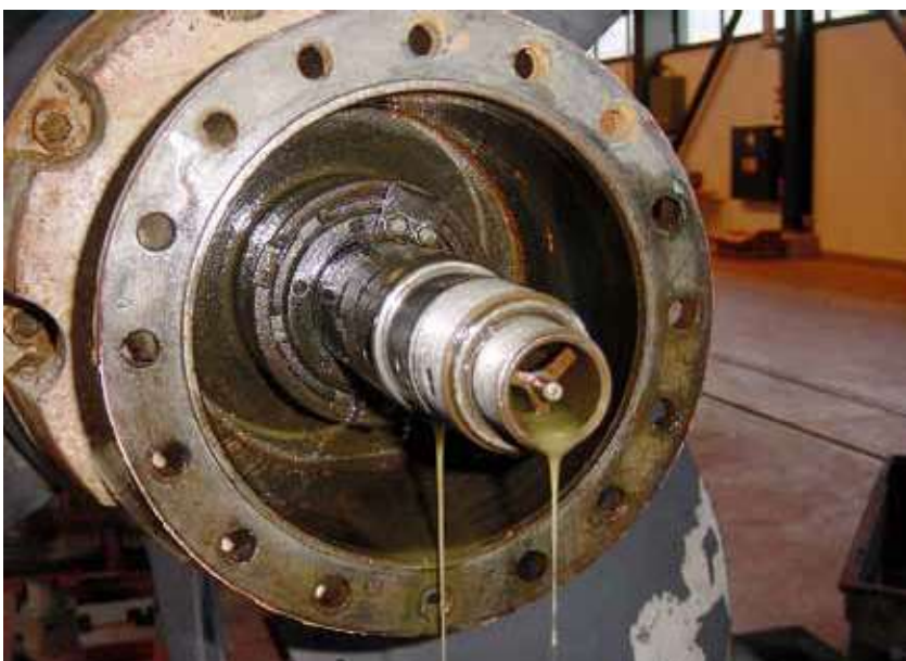
Nabe geöffnet, Kolben entfernt