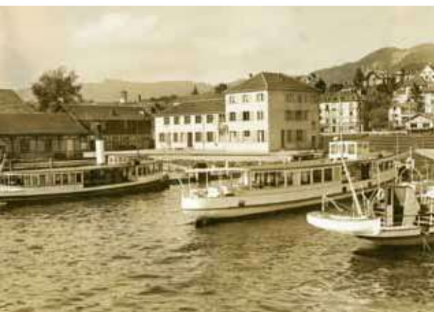
MS Etzel in der Werft, 1935