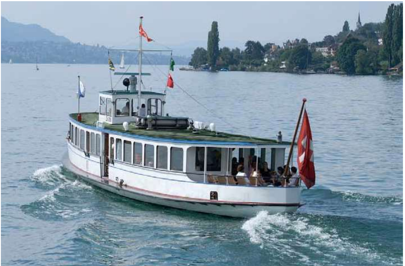
MS Etzel von Achtern