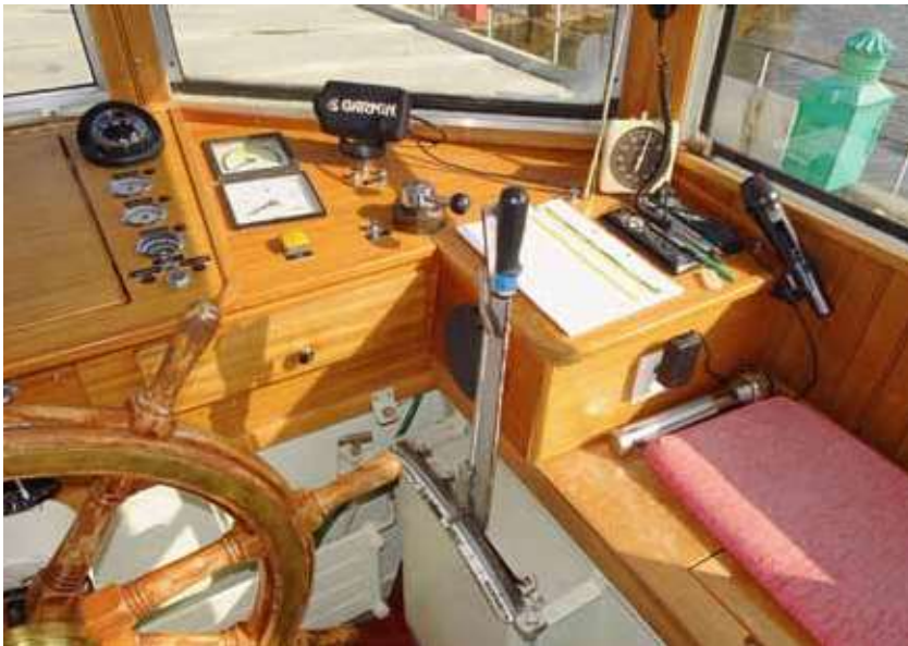
Steuerhaus und Verstellhebel MS Etzel