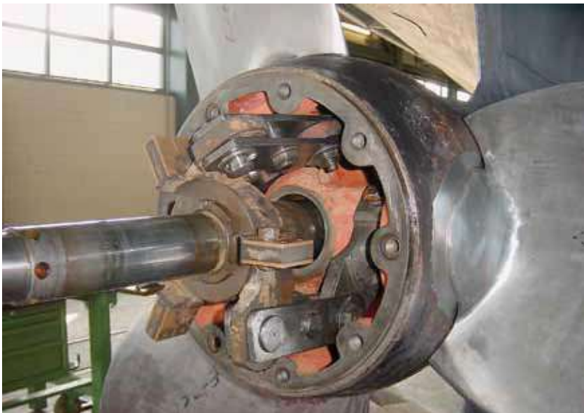
Stern MS Etzel mit Flügeln